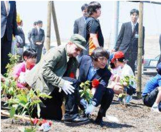
安藤氏・ボノ氏らによる記念植樹

平成20年春期植樹(平成20年5月27日、平成20年5月31日) 5月27日、アイルランドの世界的に有名なロックバンドU2のボノ氏を迎え、都内小学生やインターナショナルスクール生とともに記念植樹を行いました。