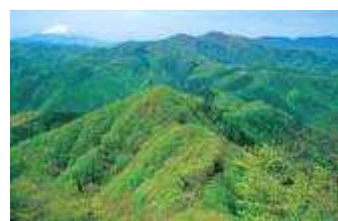
花粉の少ない森づくり