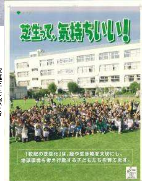
校庭芝生化ポスター