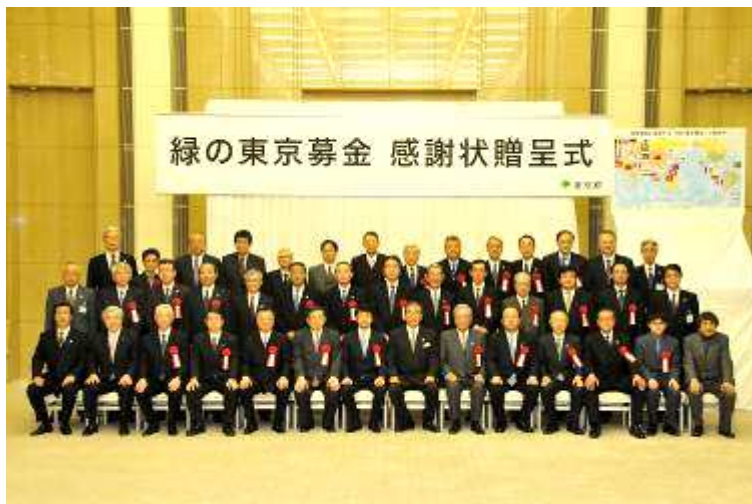
第3回感謝状贈呈式(平成21年2月13日)