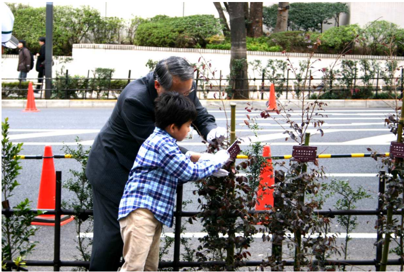
植樹開始式(平成 21 年 2 月 16 日)