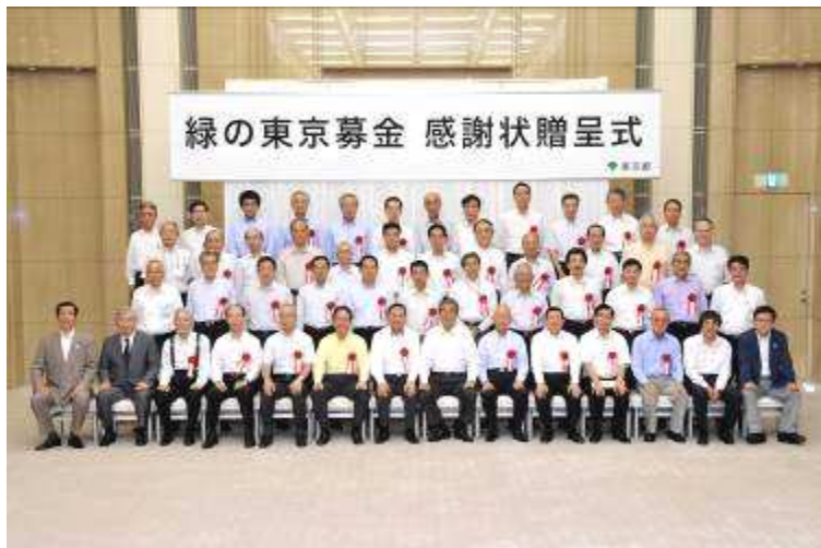
第2回感謝状贈呈式(平成20年7月1日)

平成21年2月13日に開催した第3回感謝状贈呈式では、知事賞を12者、環境局長賞を34者に贈呈いたしました。