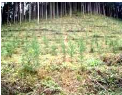
植栽された花粉の少ないスギ (青梅市柚木)

平成 20 年度の花粉の少ない森づくりの植栽面積は、19.42ha、58,260 本です。そのうち、 緑の東京募金を充当して実施した事業は、約 1.3ha、3,900 本です。