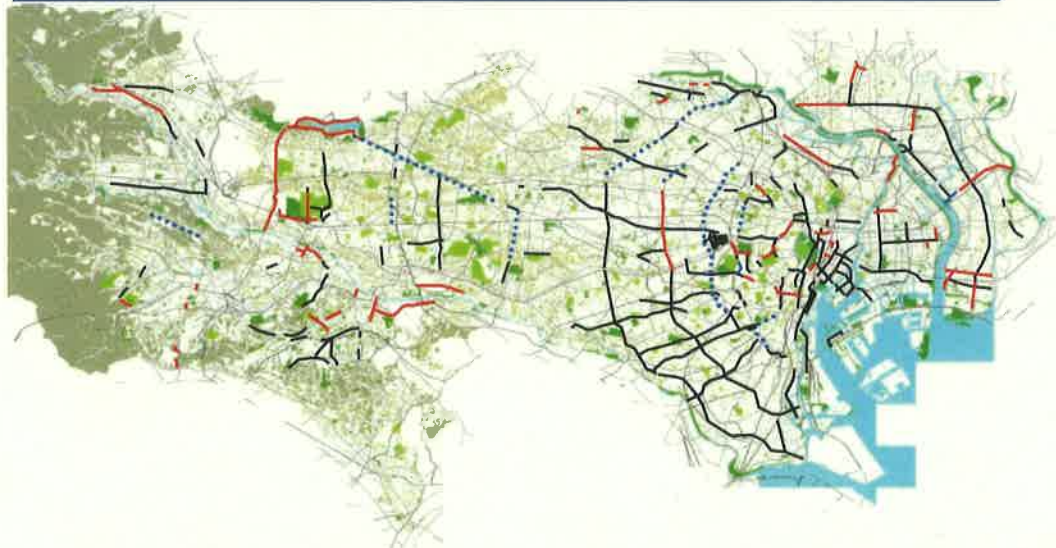
平成23年度「街路樹の充実」実施箇所図

平成23年度は、既設道路内の45区間において、1万7千本を超える中高木を新たに植栽するなど「魅せる街路樹」の整備に取り組みました。 緑の東京募金は、これらの植栽工事費の一部に充当いたしました。