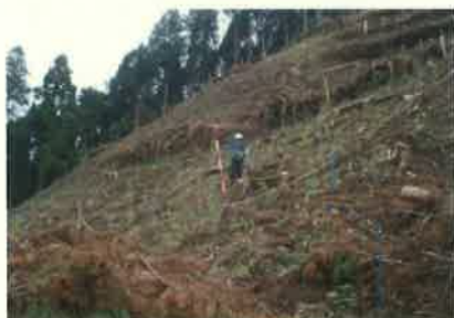
植栽された花粉の少ないスギ (あきる野市深沢)

花粉の少ない森づくりでは、スギやヒノキ等の人工林を伐採し、花粉の少ないスギ等を植栽することにより樹種更新を図り、発生するスギ花粉量の削減を目指しています。平成23年度の花粉の少ない森づくりの植栽面積は、103.15ha、194,810本です。