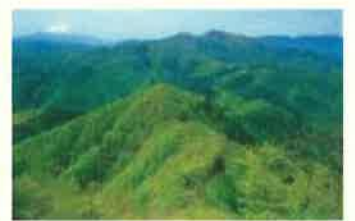
花粉の少ない森づくり

※ 海の森の整備事業は、目標額を達成しましたので募金の受入を終了しています。ありがとうございました。