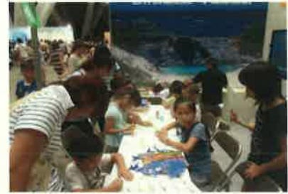
丸の内キッズフェスタ2011

平成23年8月15日(月)～17日(水)東京国際フォーラムで開催された「KIDS お楽しみ出展」に参加。小笠原世界自然遺産の紹介やゴーヤ等による緑のカーテンの展示などとともに緑の東京募金の周知活動を行いました。