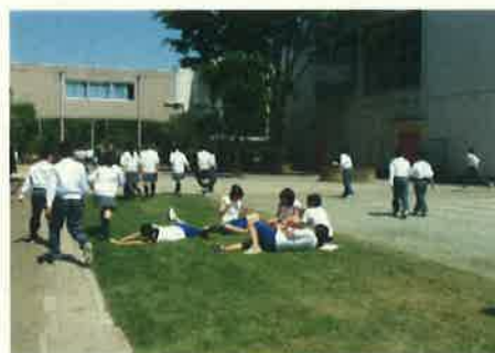
貸し出した天然芝生の上で遊ぶ子供たち

また、芝生の維持管理にあたって、維持管理組織のリーダーを養成するため、保護者、教員、地域住民など、日常的に維持管理に携わる人達に対して、講習しました。