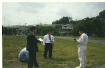
専門家派遣による指導・助言