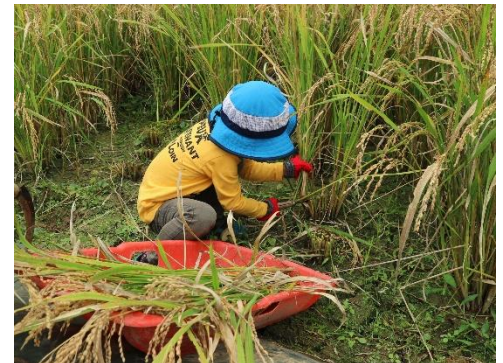
＜体験プログラムの様子＞