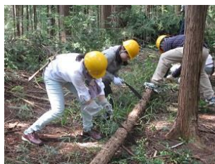
緑をまもる人材育成※