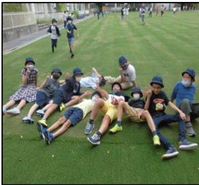
<令和4年度に校庭を芝生化した学校>

東京都では、子供たちが芝生の上で思いきり遊ぶことができるように、これまでに、526校の公立小中学校で芝生化を実施してきました。令和4年度は芝生化を希望する学校1校の工事経費の一部(合計 1,930 m 2 )に「花と緑の東京募金」を充当しました。