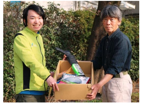
＜ボランティア団体への用具支給＞ ※写真は令和3年度

都民の幅広い層に環境に対する関心を高めてもらうため、「東京グリーンシップ・アクション」を実施しています。「東京グリーンシップ・アクション」とは、企業等の社会貢献の場として保全地域を活用する取組で、令和4年度は22の企業が緑地保全活動を行うことができました。