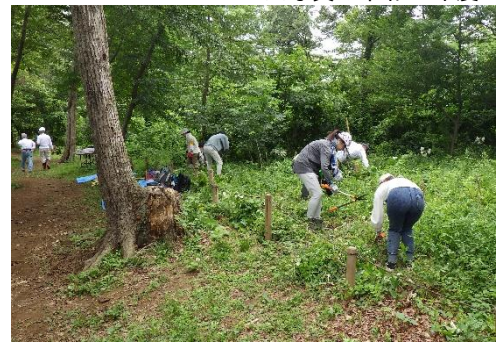
＜東京グリーンシップ・アクションの様子＞