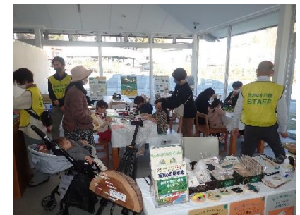
<TAKA0599 ミュージアム木工教室>