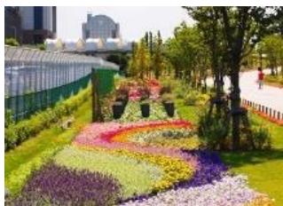
花と緑のおもてなし