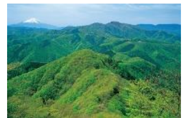
花粉の少ない森づくり

令和4年度は、対象事業の4事業に合計 20,237,844 円 を取り崩して充当いたしました。平成28年度からの累計の充当額は 141,097,298 円 となりました。